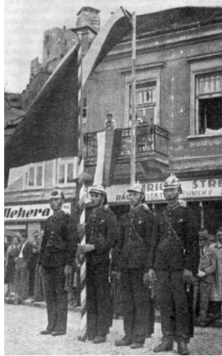
Z osláv 25. výročia ZHJ na Slovensku v Trenčíne