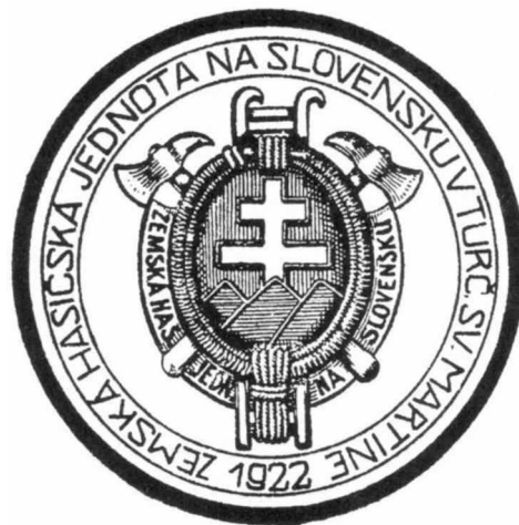
Pečiatka ZHJ na Slovensku z roku 1922