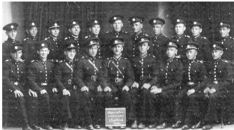
Zakladateľská generácia hasičského zboru v Opatovej nad Váhom, 1939.