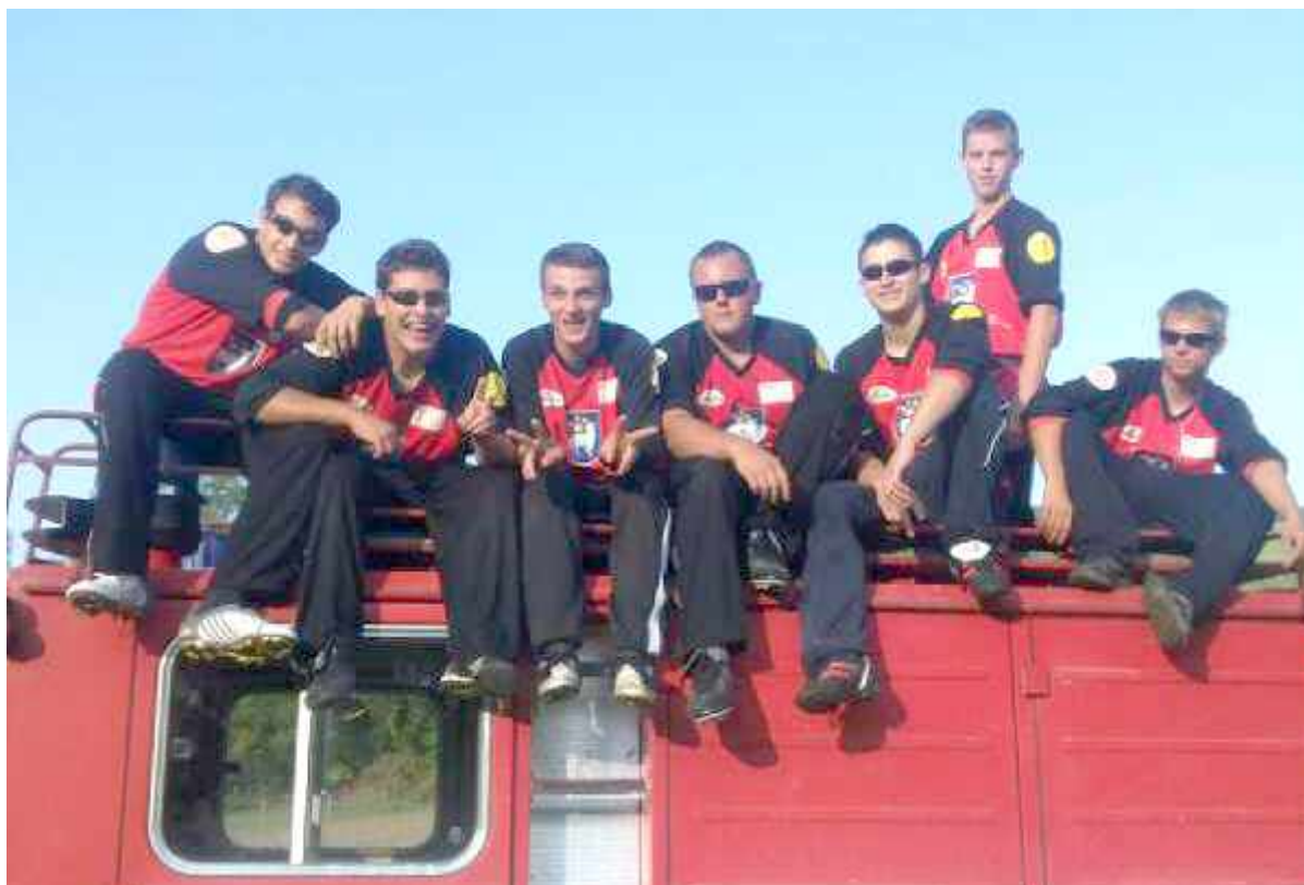
Úspešné družstvo mužov DHZ Trenčín - Záblatie v disciplínach požiarnického športu, 2010