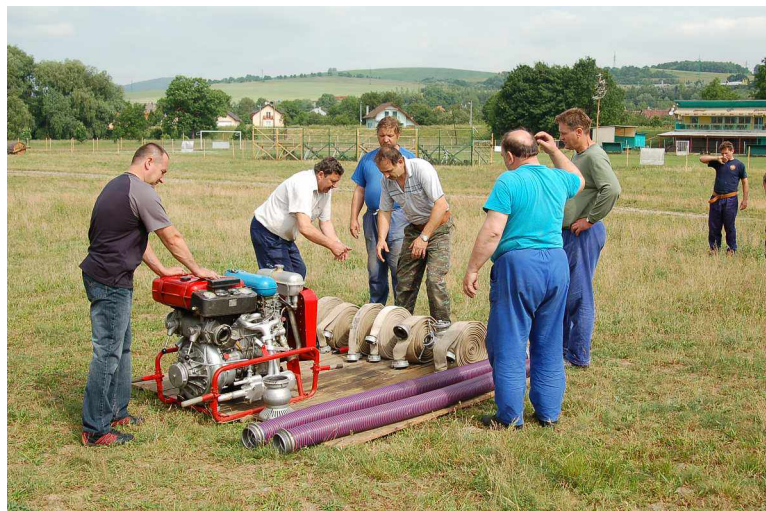
Požiarne družstvo mužov Fakultnej nemocnice Trenčín pri nácviку požiarneho útoku